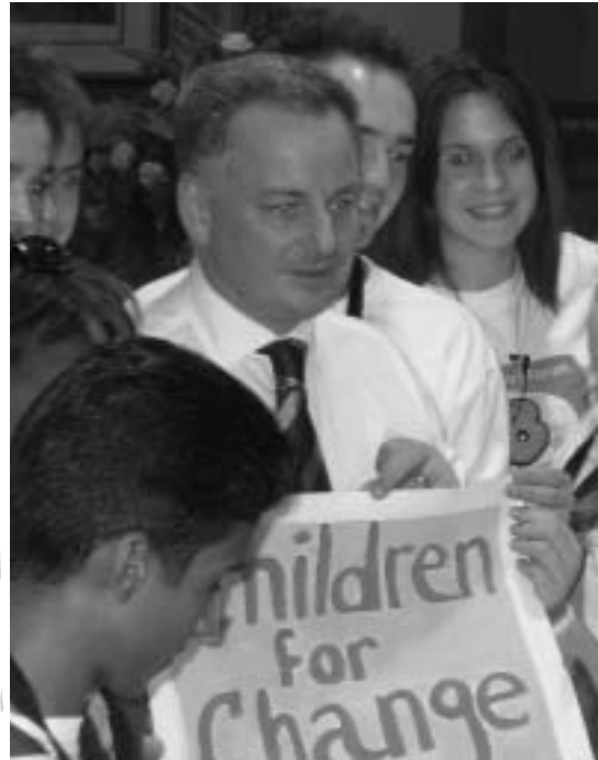
Jack McConnell, le Premier Ministre écossais, tient le Plan des Enfants pour l'Action et le Changement présenté par les délégués du C8

A notre école, nous avons fait d'autres choses dans le passé pour aider les pauvres dans les pays en développement mais la charité n'est pas suffisante.