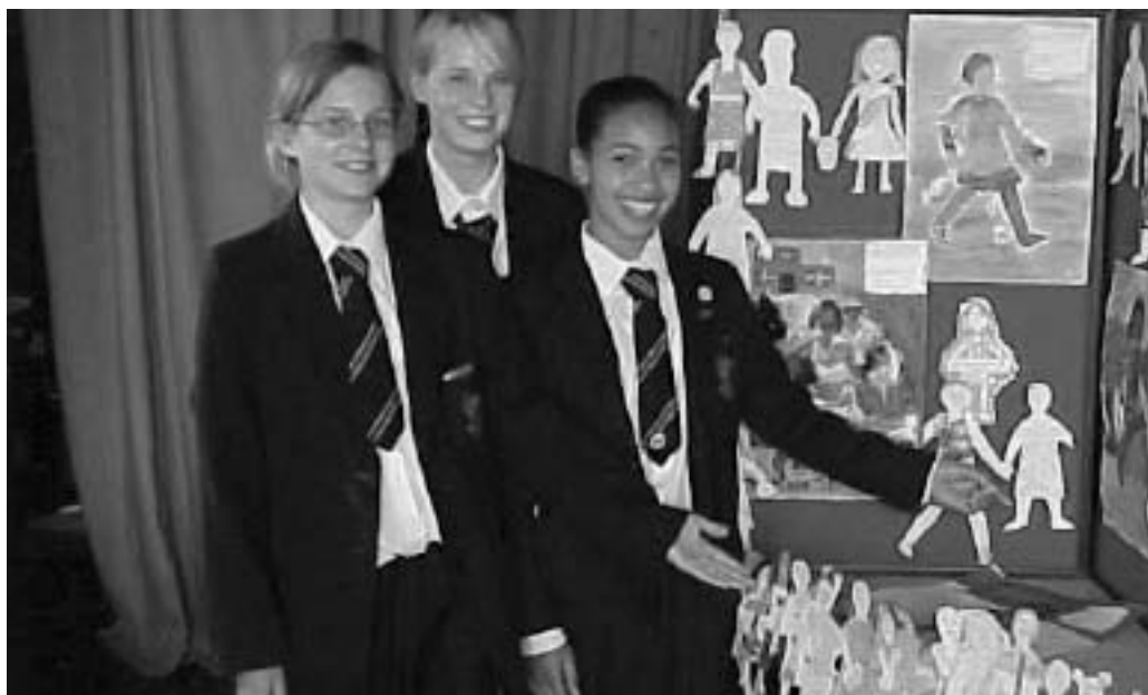
Des filles de l'école King John, Benfleet, Royaume-Uni, qui ont fait plus de 1000 personnages en papier.

Nous avons envoyé nos personnages en papier aux leaders du G8 qui vont prendre des décisions importantes sur le commerce et la dette, pour leur dire ce que nous ressentons au sujet de la pauvreté dans le monde. Les personnages sont une façon de nous faire entendre.