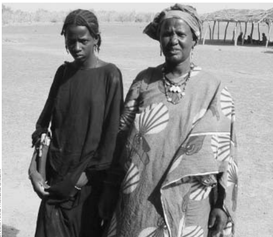
'Infrikawene, Mali: une animatrice (à droite) avec l'élève qu'elle soutient.'

Les animatrices sont des femmes locales, la plupart d'entre elles ont terminé le grade 6 de l'école primaire. Les femmes font du lobby avec parents, membres de la communauté et enseignants, pour changer les attitudes envers les capacités des filles et leur droit d'aller à l'école. En tant que femmes relativement bien éduquées dans un emploi rémunéré pour promouvoir l'éducation, les animatrices jouent un rôle de modèle positif pour les filles locales.