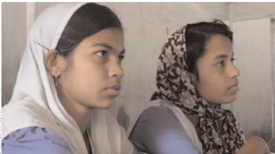
Ecolières du Bangladesh (voir encadré pour l'étude de cas).

certaines des thèmes transversaux et identifie les domaines dans lesquels des actions doivent être menées. Parmi eux on trouve : adresser les facteurs sociaux limitant la demande pour l'éducation des filles et des femmes ; s'assurer que l'éducation pour les filles et les femmes soit perçue par celles-ci et par leur communauté comme ayant de la valeur et comme étant pertinente, et s'attaquer aux cultures scolaires pour s'assurer que les écoles soient des endroits accueillants pour les filles. Il est pressant de faire en sorte que les professeurs, et particulièrement les professeurs femmes, reçoivent le soutien dont ils/elles ont besoin pour transformer les écoles en des endroits où les stéréotypes et les inégalités liés au sexe peuvent être remis en question et où le harcèlement sexuel et les violences faites aux enseignantes et aux élèves aient disparu.