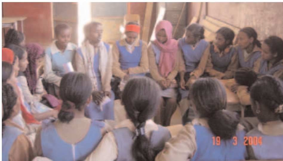
Sessions de santé reproductive au lycée St George, Mendefera, Erytrée.